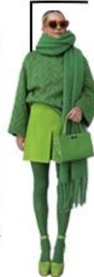
yellow, green green