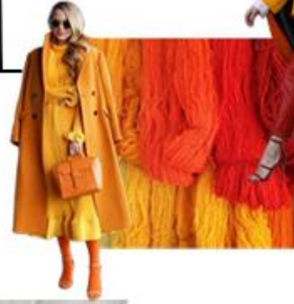
red red, orange orange yellow, orange