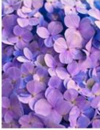
blue, purple purple red, purple

در تیوری رنگ، رنگ های هم خانواده گروهی از رنگ ها هستند که در چرخه ی رنگ در کنار یکدیگر قرار دارند. (دو یا سه رنگ در کنار هم) مثل: قرمز- نارنجی قرمز- نارنجی