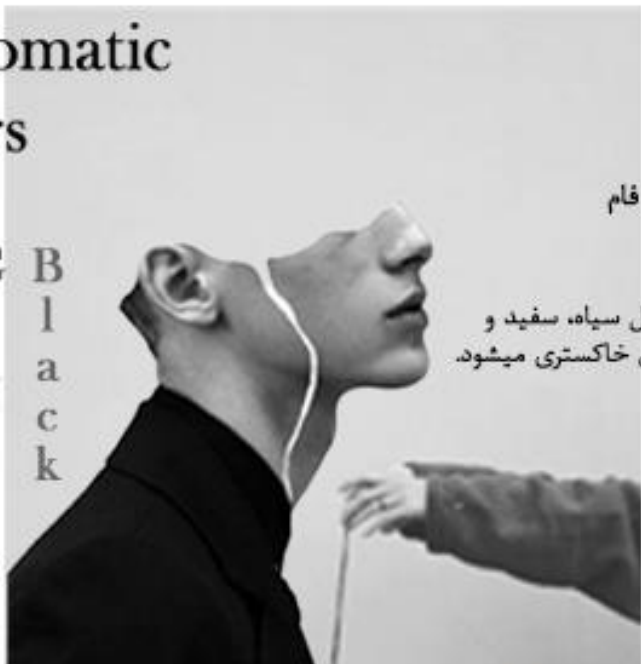
رنگ های بدون فام

این رنگ ها شامل سیاه، سفید و انواع تنالیته های خاکستری میشود.