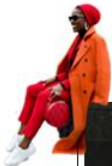
warm colore outfit