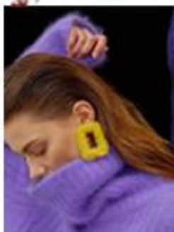
cold colore outfit