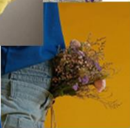
warm colore outfit