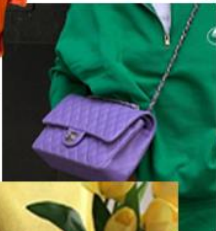
warm colore outfit