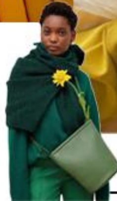
yellow, green _green_ blue, green